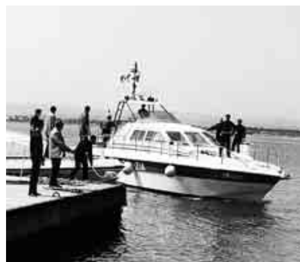
IL PORTO DI AVOLA

La problematica rimane irrisolta mentre proseguono i lavori del depuratore